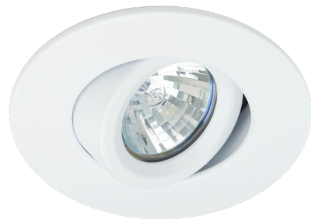
T3250-01 (illustrée) (Lampe non incluse)