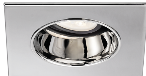
R2100-04S (illustrée) (Lampe non incluse)