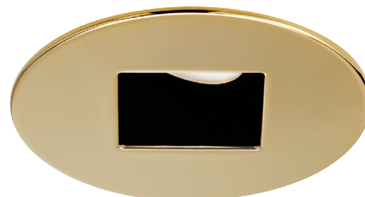
R2051-03 (illustrée) (Lampe non incluse)