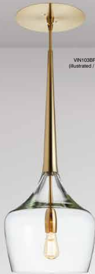
VIN103BR-H06 (illustrated / illustré)