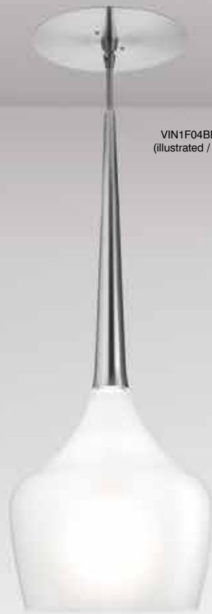
VIN1F04BR-H06 (illustrated / illustré)