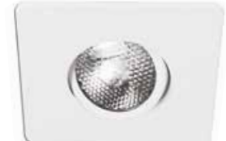
Square Adjustable Trim Garniture carrée orientable