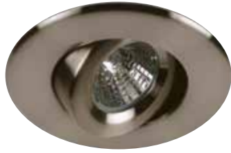
Adjustable Trim Garniture orientable