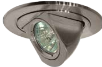
Square Face Elbow Trim (MR16 only) Garniture avec coude carré (MR16 seulement)