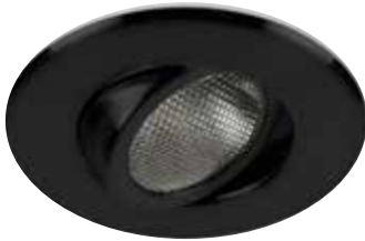
Adjustable Trim Garniture orientable