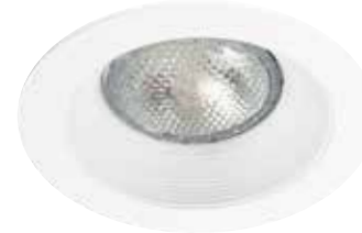
Downlight Trim with White Stepped Baffle Garniture en retrait avec déflecteur blanc étagé