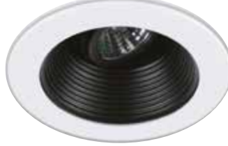
Adjustable Trim with Black Stepped Baffle Garniture orientable avec déflecteur noir étagé