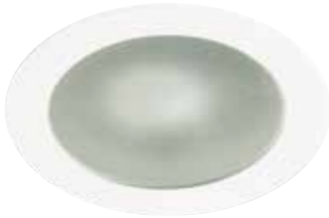
Shower Trim with Frosted Lens Garniture de douche avec lentille givrée