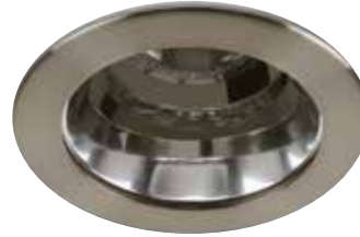
Downlight Trim with Clear Reflector Garniture en retrait avec réflecteur clair