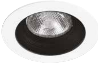
Downlight Trim with Black Stepped Baffle Garniture en retrait avec déflecteur noir étagé