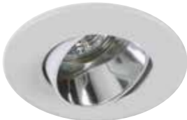
Adjustable Trim with Clear Reflector Garniture orientable avec réflecteur clair