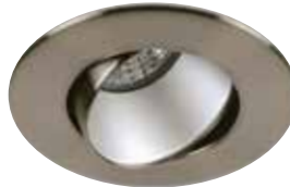
Adjustable Trim with Matte Reflector Garniture orientable avec réflecteur mat