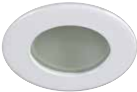
Shower Trim with Frosted Lens Garniture de douche avec lentille givrée