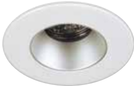
Downlight Trim with Matte Reflector Garniture en retrait avec réflecteur mat