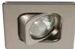
Square Adjustable Trim Garniture carrée orientable