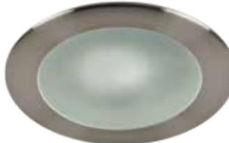
Shower Trim with Frosted Lens Garniture de douche avec lentille givrée