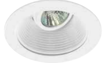
Adjustable Trim with White Stepped Baffle Garniture orientable avec déflecteur blanc étagé