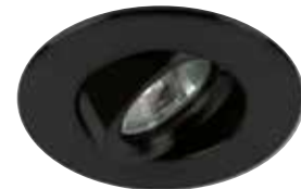
Adjustable Trim Garniture orientable